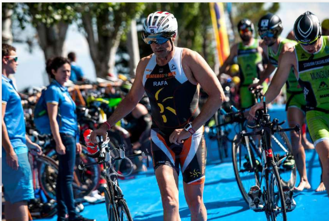
IV TBG Triatlón Olímpico Bajo Gállego.

Tras la salida de la transición, los binatletas dispondrán de unas duchas de paso obligado que les permitirán acondicionar la temperatura corporal antes de entrar en contacto con el agua del Embalse.