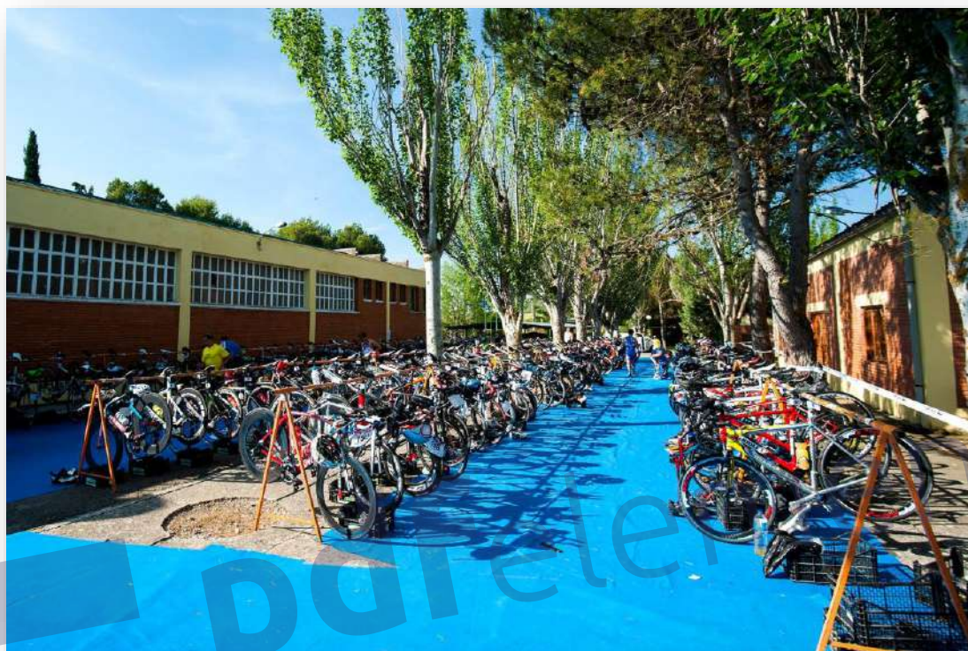
IV TBG Triatlón Olímpico Bajo Gállego.

En la primera transición los binatletas cambian de equipamiento de la natación al ciclismo. Se encontrará en el interior del Club Náutico Sotonera.