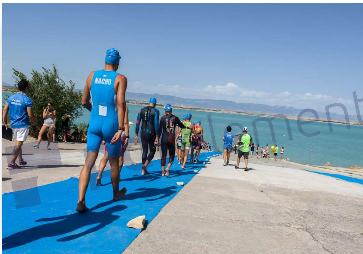
Primera edición del Binatlón de La Sotonera, en 2016.

La salida del Binatlón se dará desde dentro del agua, entre dos boyas que definirán una línea imaginaria tras la cual se deberán encontrar todos los participantes antes del comienzo de la prueba.